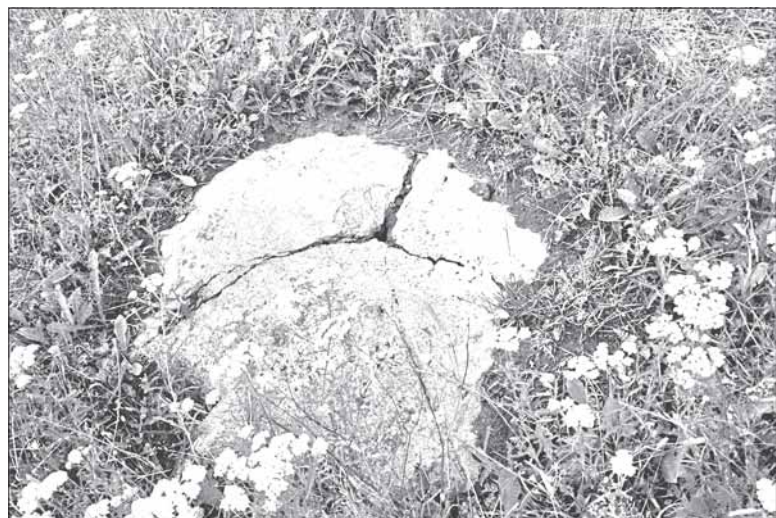
Камень на востраве, у які трапляе маланка.

Увосень, калі начныя халоды расфарбуюць лісце і чараты ў тысячы барваў, над возерам стане белым-бела ад лебедзяў і буслоў, вядомых і невядомых птушак, што збіраюцца адсюль у далёкую Птушыную Дарогу. А калі ўвесь гэты знямелы край ухутаюць снежныя сувоі, і ён пераўтвораецца ў неабсяжную ледзяную пустыню, сюды залятуць белыя пардвы-курапаткі, а за імі і белыя палярныя совы. І сярод гэтае белае цішы пачуецца раптам адно самотны царкоўны звон.