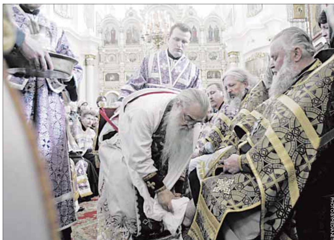
Паводле царкоўнай традыцыі перад Вялікаднем мітрапаліт у храме абмыў ногі япіскапам Беларускай праваслаўнай царквы.

Вілейка Віленскай губ. 5 красавіка ў рэстаране мяшчане пілі, дый, відаць, перапіліся праз меру, пачалі сварыцца і аднаму некалькі разоў усадзілі ў бок нож. Стараюцца вілейскія мяшчане! «Наша Ніва». №16. 1909