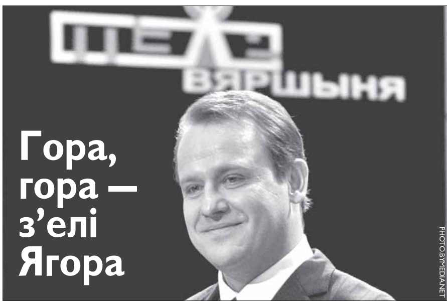
Заява Хрусталёва пра сыход з АНТ была падпісаная імгненна.

У пачатку красавіка 2009 г. ўрад Беларусі заявіў, што перамовы з Расіяй наконт дадатковага крэдыту 100 млрд расійскіх рублёў працягваюцца.