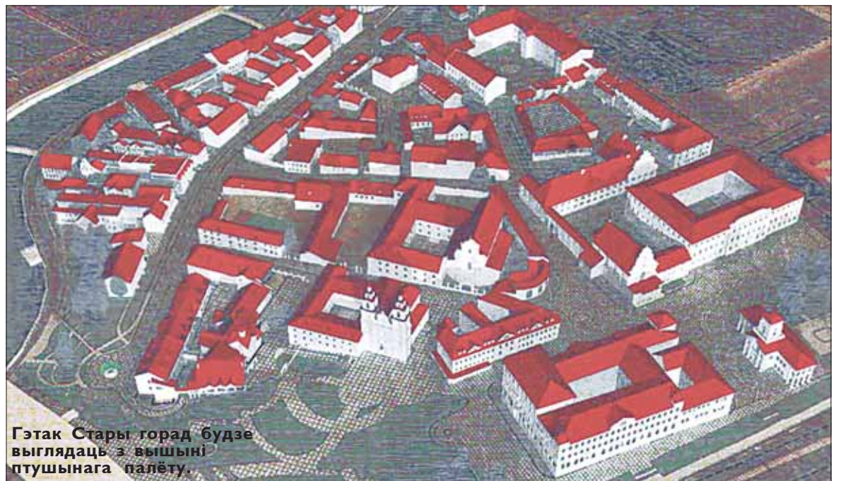
Гэтак Стары горад будзе выглядаць з вышыні птушынага палёту.