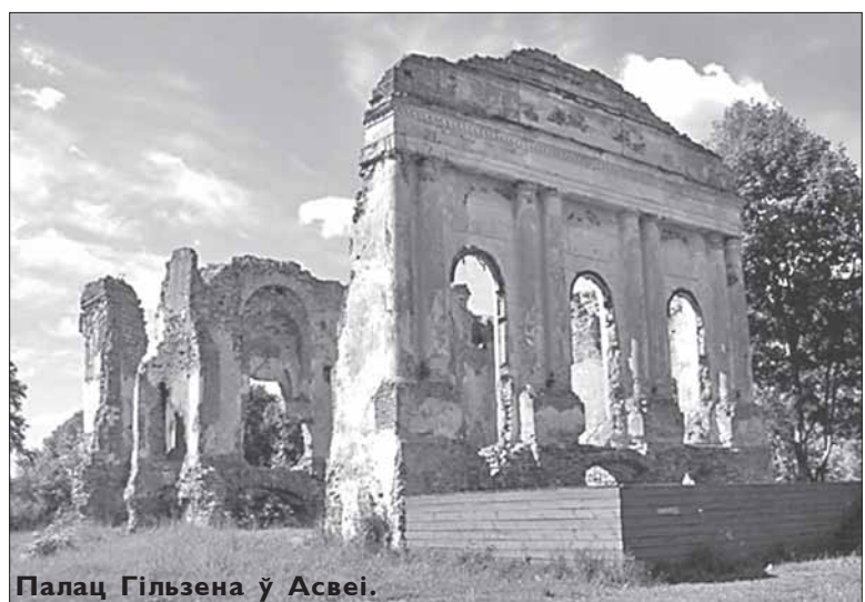
Палац Гільзена ў Асвеі.

жу. Славутасцю Асвеі быў вялізарны палац, збудаваны ў XVIII ст. мінскім ваяводам Янам Аўгустам Гільзенам. Хорам з пяці корпусаў з чатырма галерэямі выглядаў зверху вялізнай птушкай з распасцёртымі крыламі і здзіўляў планіроўкай: галоўных пад'ездаў было чатыры, па ліку пораў году; унутраных уваходаў — дваццаць, па ліку месяцаў; пакояў і залаў было па колькасці тыдняў у годзе, вокнаў — па ліку дзён. Тут была люстраная бальная зала ў стылі Людовіка XV.